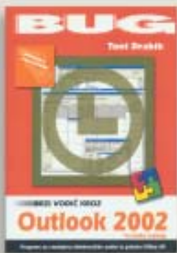
Kat. br. 9505 ■ ISBN 953-232-010-5 ■ broj stranica: 208 ■ 200x140 mm ■ uvez meki, spiralni

Najnovija verzija Microsoftovog operacijskog sustava za PC računala rasprostranila se među korisnicima većom brzinom nego bilo koja prethodna. Znati raditi s Windowsima XP sinonim je za poznavanje rada s računalom. Korak po korak ova će vas knjiga upoznati s upravljanjem datotekama i direktorijima, prilagođavanjem Windowsa XP osobnom ukusu, učinkovitim održavanju računala, ali i s korištenjem svih programa koji se dobivaju s operacijskim sustavom, namijenjenih radu s Internetom, e-mailom, računalnim mrežama, multimedijom i ostalim primjenama računala.