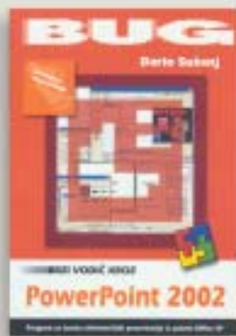
Kat. br. 9506 ■ ISBN 953-232-011-3 ■ broj stranica: 202 ■ 200x140 mm ■ uvez meki, spiralni

Razmjena elektroničke pošte u današnje vrijeme predstavlja temeljni način komuniciranja kako u poslovnoj, tako i u privatnoj sferi života, a najbolji alat za obavljanje te radnje jest Microsoftov Outlook 2002, jedna od aplikacija iz paketa Office XP. Osim rada s e-mailom, ovaj program olakšat će vam i planiranje vaših obaveza, dogovaranje sastanaka, čuvanje adresara, dok će u mrežnom okruženju sve to uskladiti i s vašim suradnicima. Da biste na najbrži mogući način savladali sve finese Outlooka 2002, poslužite se ovom knjigom – odvest će vas u svijet moderne, elektroničke komunikacije.