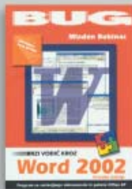
Kat. br. 9502 ■ ISBN 953-232-007-5 ■ broj stranica: 194 ■ 200x140 mm ■ uvez meki, spiralni

Za arhiviranje bilo kojeg tipa podataka nekada su bile potrebne tone papira i sobe krcate prašnjavim ormarima, dok se za njihovo pretraživanje moralo uložiti sate i sate truda. Danas je za arhiviranje podataka dovoljno posjedovati računalo s instaliranim Accessom 2002, programom koji se nalazi u Microsoftovom Office XP paketu, s kojim je za pronalaženje nekog podatka dovoljna sekunda ili dvije.