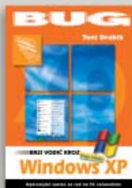
Kat. br. 9504 ■ ISBN 953-232-009-1 ■ broj stranica: 178 ■ 200x140 mm ■ uvez meki, spiralni