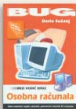
Kat. br. 9508 ■ ISBN 953-232-019-9 ■ broj stranica: 190 ■ 200x140 mm ■ uvez meki, spiralni

Imate li dva ili više računala koji čuče u istoj prostoriji, grijeh je ne povezati ih u lokalnu mrežu. Male računalne mreže, popularnije kao "kućne mreže" omogućavaju vam lako i brzo dijeljenje računalnih resursa, korištenje zajedničkog pisaača, zajedničke modemske veze prema Internetu, ali i užitek mrežnog igranja računalnih igara. Ova je knjiga neizostavan priručnik za svakoga tko na bilo koji način želi izgraditi malu, kućnu mrežu. Posebnost knjige je ta što obrađuje i bežične mreže.