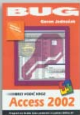
Kat. br. 9501 ■ ISBN 953-232-006-7 ■ broj stranica: 168 ■ 200x140 mm ■ uvez meki, spiralni