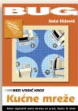
Kat. br. 9507 ■ ISBN 953-232-033-4 ■ broj stranica: 188 ■ 200x140 mm ■ uvez meki, spiralni

U svijetu odavno, a kod nas odnedavno, PowerPoint je postao aplikacija bez koje je nezamislivo održavanje bilo kakve prezentacije, radilo se o poslovnoj demonstraciji, sveučilišnom seminarskom radu ili jednostavno o razmjeni ideja na kakvom poslovnom sastanku. Najnovija verzija, PowerPoint 2002, jedna od ključnih aplikacija Office XP paketa, donosi i mnoštvo novih mogućnosti u izradu dopadljivih elektroničkih prezentacija.